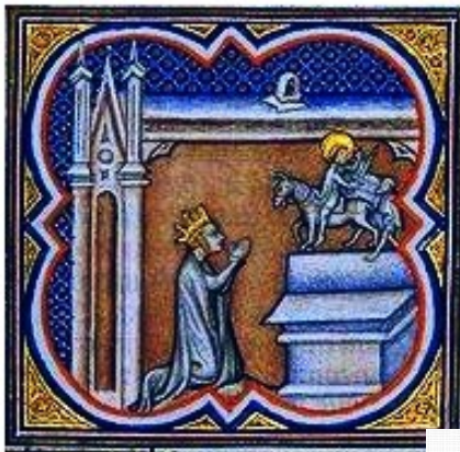
Sainte CLOTILDE(475-545) nièce de Carétène femme de CLOVIS prie Saint-Martin

Soutien des sceptres, parure de la terre et lumière de l'univers, Carétène désire que ce tombeau protège ses membres. C'est elle qui fonda en personne ce temple qui remplit d'échos l'univers et dédia aux chœurs angéliques l'éminent sanctuaire.. Lorsque, après son dixième lustre, la mort envieuse la ravit au monde, la lumière était déjà revenue seize fois dans le mois de septembre de l'année qui porte le nom du consul Messala (16 septembre 506