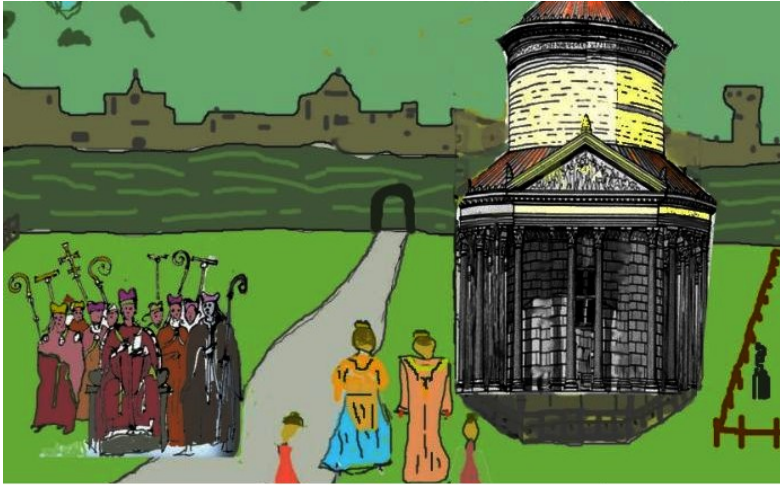
Reconstitution imaginaire de la cérémonie de dédicace de la Basilique Saint-Michel de Carétène à Lyon en 500

Vers l'actuelle Place A.Vollon, à proximité d'une voie transversale reliant deux ponts de